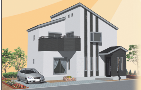
※イメージ/パースにつき実際とは異なります。