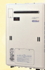
※写真はプリアール・エコジョーズ235-R400型です。

リビングやバスルーム、キッチンでの給湯・暖房をecoジョーズ1台でトータルにまかなえます。さらに、熱効率も高く、省エネルギーでガス代もおトクです。