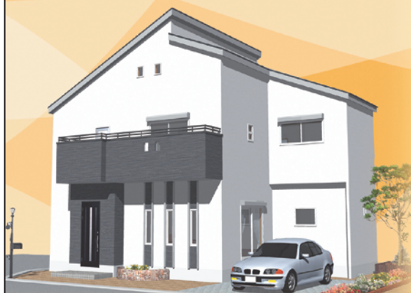
※イメージ/パースにつき実際とは異なります。