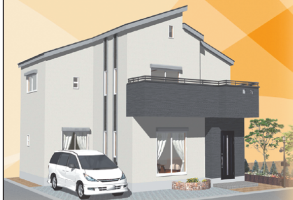
※イメージ/パースにつき実際とは異なります。